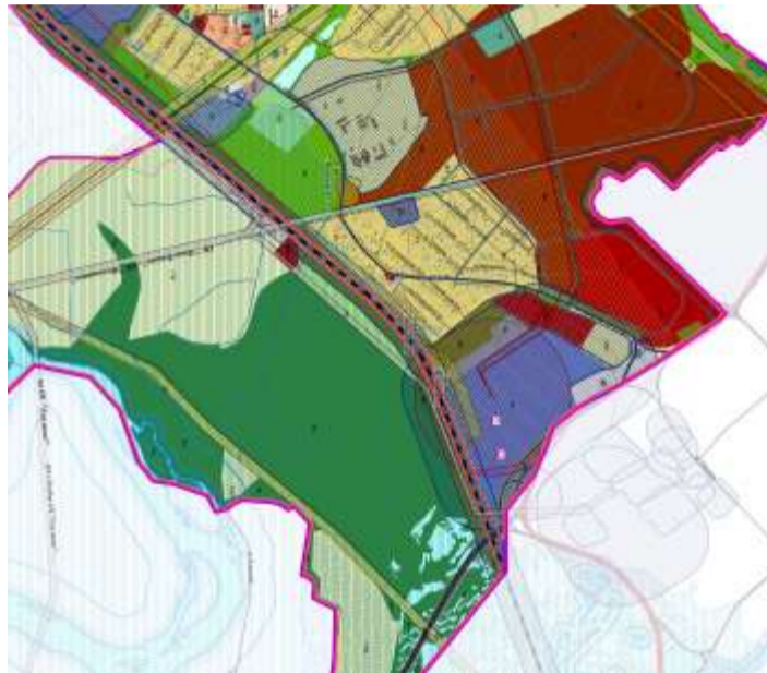
Фрагмент карты градостроительного зонирования