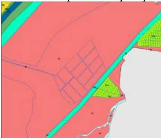
Фрагмент схемы планируемых границ функциональных зон с отображением параметров планируемого развития

участки с кадастровыми номерами 338:06:130821:2601, 38:06:130821:2604, 38:06:130821:2605, 38:06:130821:2606, 38:06:130821:4334, 38:06:130821:4335, 38:06:130821:4336, 38:06:130821:4337, 38:06:130821:4342, 38:06:130821:4343, 38:06:130821:4363, 38:06:130821:4364, 38:06:130821:4365, 38:06:130821:4366, 38:06:130821:4368, 38:06:130821:4395, 38:06:130821:4396, 38:06:130821:4406, 38:06:130821:4407, 38:06:130821:4408, 38:06:130821:4409, 38:06:130821:4410, 38:06:130821:4444, 38:06:130821:4445, 38:06:130821:4448, 38:06:130821:4449, 38:06:130821:4450, 38:06:130821:4451, 38:06:130821:4452, 38:06:130821:4453, 38:06:130821:4454, 38:06:130821:4455, 38:06:130821:4456, 38:06:130821:4457, 38:06:130821:4475, 38:06:130821:4476, 38:06:130821:4478, 38:06:130821:4479, 38:06:130821:4480, 38:06:130821:4481, 38:06:130821:4482, 38:06:130821:4483, 38:06:130821:4484, 38:06:130821:4485, 38:06:130821:4486, 38:06:130821:4487, 38:06:130821:4488, 38:06:130821:4489, 38:06:130821:4490, 38:06:130821:4638, 38:06:130821:46397 с видом разрешенного использования для ведения крестьянского (фермерского) хозяйства, категория земель – земли населенных пунктов. В настоящее время территория свободна от застройки