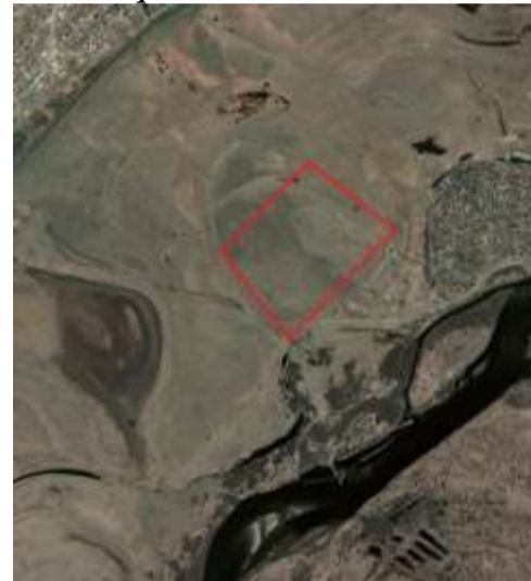
Фрагмент современного использования территории

экономических и экологических факторов и в целях обеспечения устойчивого развития территории, инженерной, транспортной и социальной инфраструктуры, было определено общее назначение рассматриваемой территории как зоны рекреационного назначения для организации отдыха.