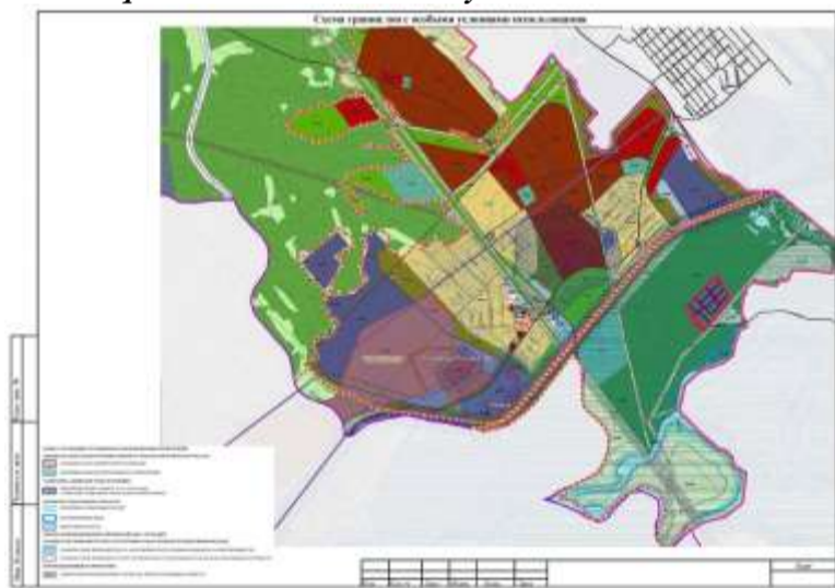
Схема границ зон с особыми условиями использования