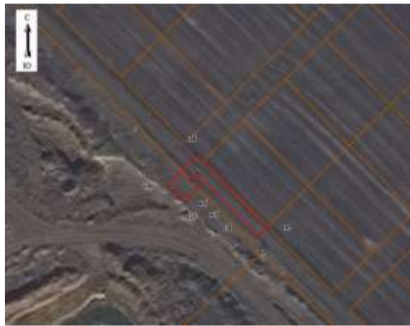
Масштаб 1: 1000